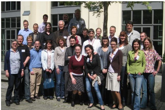
Участниците в първата среща по проект PassREg

Партньори по проекта: ЕнЕфект (България), British Research Establishment - BRE